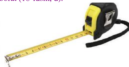
d) o‘rama metr (ruletka)