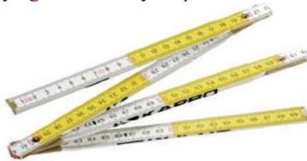
b) taxlanma metr