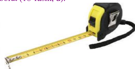
d) o‘rama metr (ruletka)