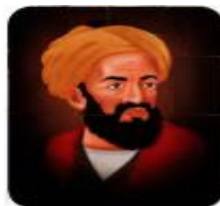
Abu Ali ibn Sino

Buyuk allomalarimizdan biri Abu Ali ibn Sino butun dunyoga Avitsenna nomi bilan tanilgan. U yoshligidan tibbiyot ilmi bilan jiddiy shug‘ullangan. Ibn Sino juda ko‘p kasalliklarni o‘rgangan, ko‘p kitob o‘qigan, odamlarni davolagan, tajribalar o‘tkazib, natijalarini yozib borgan. Keyinchalik bularning barchasi “Tib qonunlari” deb nomlangan bebaho asarini yaratishda unga yordam berdi. Bu kitob bir necha yuz yil davomida ko‘plab olimlar uchun ensiklopediya bo‘lib xizmat qildi.