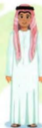
Birlashgan Arab Amirliklari

IV. Yangi mavzuni mustahkamlash: o'tilgan mavzu yuzasidan suhbat, savol-javob o'tkaziladi.