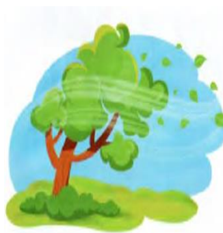
Shamol barglarni tebratmoqda