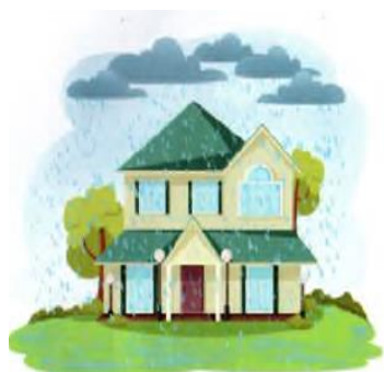
Tomga yomg'ir tomchilayapti