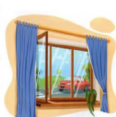
Ko'chadan avtomobil o'tib ketdi