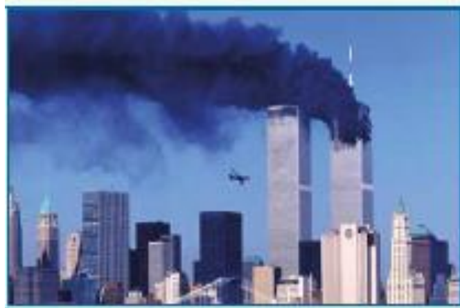
2001-yil 11-sentyabr kuni terroristlar qo‘lga olgan samolyotlar kelib urilishi natijasida portlagan Jahon savdo markazining egizak binolari

IV. Yangi mavzuni mustahkamlash: O‘zbekiston respublikasi Konsitutsiyasi –inson huquqlari kafolati