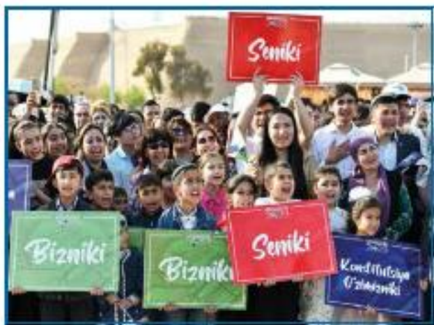
2023-yil 30-apreldagi O‘zbekiston Respublikasi referendumini arafasida o‘tkazilgan “Konstitutsiya meniki, seniki, bizniki! Konstitutsiya o‘zimizniki” shiori ostidagi targ‘ibot tadbiridan lavha.