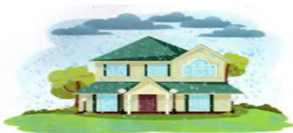
Tomga yomg‘ir tomchilayapti

Ko‘zimiz bilan ko‘rmasak ham, tovushlar har qanday mavzuni bayon qilishga qodir bo‘layotganini his qilishimiz mumkin.