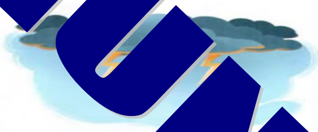
Momam gumbur yozib

Bu tovushlar shovqinli tovushlar deyiladi.