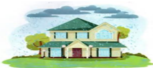
Tomga yomg‘ir tomchilayapti

Ko‘zimiz bilan ko‘rmasak ham, tovushlar orqali nima bo‘layotganini his qilishimiz mumkin.