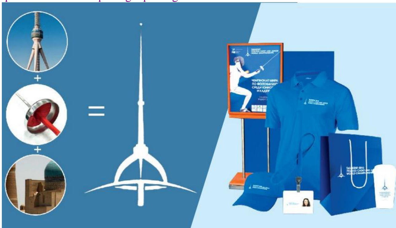
9-rasm. Qilichbozlik bo'yicha xalqaro musobaqa emblemasi

assotsiativ, ekspressiv, funksional bo'lishi kerak. Logotip belgi, ramz, qiziqarli shriftlardan tarkib topgan elementlarni birlashtirish vositasida yaratilishi ham mumkin. Masalan, yozuv belgiga aylanishi, shrift mavzuga oid biror grafik shakl bilan boyitilishi mumkin. Logotip kompaniyani belgi va ramzlar orqali tanishtiradi. Undagi belgi vizual qabul qilish uchun qulay va tushunarli bo'lishi kerak. Toshkentda o'smirlar o'rtasida bo'lib o'tgan xalqaro qilichbozlik musobaqasi logotipi bunga misol bo'ladi.