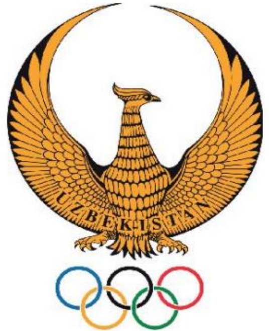
1-rasm. O'zbekiston Respublikasining Davlat gerbi hamda O'zbekiston Olimpiya qo'mitasining emblemasi