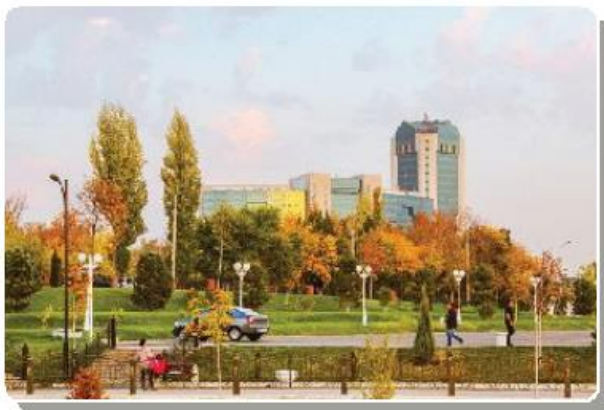
O'zbekiston tog' va shaharlarida kuz manzarasi (foto)