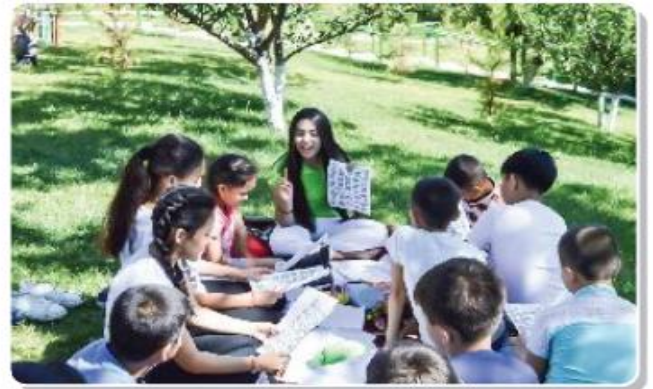
Yozgi oromgohdan lavhalar