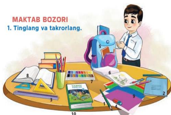
MAKTAB BOZORI 1. Tinglang va takrorlang.

V. Uyga vazifa: O‘quv qurollari rasmini chizing va nomini yozing.