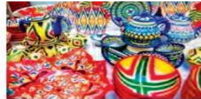
36-rasm. Hunarmandlarimiz tomonidan eksport va ichki bozor uchun ishlab chiqarilayotgan mahsulotlar.