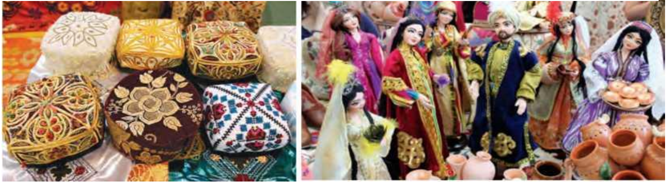
39-rasm. Hunarmandchilik mahsulotlari