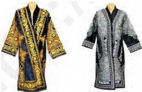
38-RASM. Tashqi shaklning uzviyligi va yaxlitligi.

Murakkab bo‘lmagan buyum kompozitsiyasining tugalligi shundan iboratki, u butunlay yaxlit hal etilgan va xuddi tabiat tomonidan yaratilganday idrok etiladi. Agar buyum bir necha qismdan iborat bo‘lsa, bu qismlarning har biri yaxlit kompozitsiyaga ega bo‘lishi kerak. Buyum qismlari bir-biriga o‘xshash bo‘lsa, ana shu o‘xshashlik ularni birlashtiradi, agar qarama-qarshi bo‘lsa, shu qarama-qarshilikning o‘zi birlashtiruvchi asos bo‘lib qoladi.