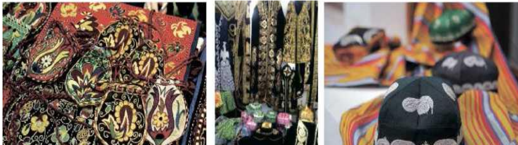
Quyida hunarmandlar tomonidan tayyorlangan buyumlardan namunalar keltirilgan (33-rasm).

Bugungi kunda xalq hunarmandchiligi bo'yicha «Usta-shogird» maktablari faoliyati kengaytirilib, ko'plab yoshlar xalq hunarmandchiligi sirlarini o'rganmoqdalar. Bundan tashqari, yosh hunarmandlar uchun «Yosb ijodkorlar», «Mustaqillik nafasida kamol topgan hunarmandlar», «Yosb kulollarning respublika ko'rgazmasi», «Mustaqil yurt hunarmandlari», «Vatanim taraqqiyotiga mening hissam» kabi ko'rik-tanlovlar tashkil etib kelinmoqda