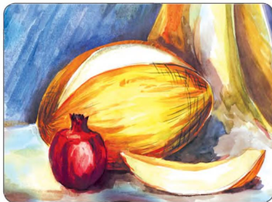
20-rasm. «Qovun va anor» mavzusida natyurmort rasmini ishlash bosqichlari.

IV. Mustahkamlash: Mashgʻulotning ushbu qismida oʻquvchilar Mashgʻulot yakunida quyida berilgan topshiriqlar va savollarga javob beradilar: