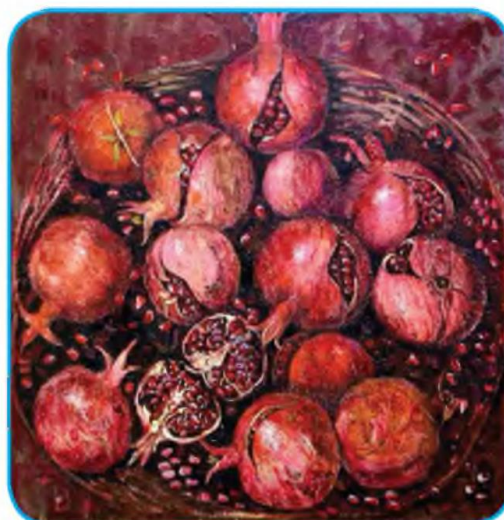
17-rasm. Nodira Oripova. Anorlar natyurmorti.