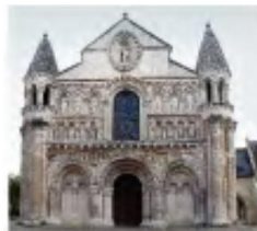
37-rasm. Fransiyadagi Puate ibodatxonasi.