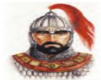
25-rasm. Bulg‘orlar xoni Asparux.