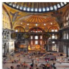
36- rasm. Avliyo Sofiya ibodatxonasi.