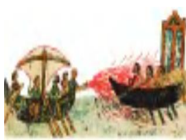
35- rasm. «Grek olovi».

IV.Mustahkamash: Oʻqituvchi yangi mavzuni mustahkamlashda oʻquvchilarga rasm tarqatadi. Oʻquvchilar shu rasimga qarab mavzuni mohiyatini ochib beradilar.