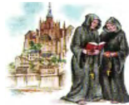
38-rasm. Oʻrta maktab oʻquvchilari.

V.Baholash: Mashgʻulotda faol qatnashgan,uyga vazifa bajargan,oʻtilgan va yangi mavzuni mustahkamlashda ishtirok etgan oʻquvchilar baholanadi.