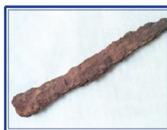
Temir pichoq. Mil. avv. VII—VI