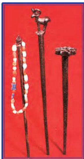
Bronzadan yasalgan to‘g‘nog‘ich va tosh munchoqlar. Mil. avv. XVII as