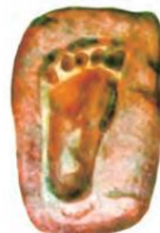
Toshga aylangan iz.