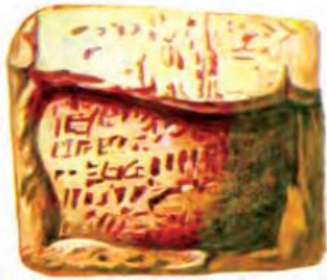
Xat yozilgan sopol.