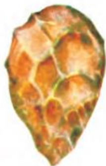
Toshdan yasalgan mehnat quroli.

Moddiy manbalar. Qadimgi odamlarning suyak qoldiqlari, ular yashagan makon, turarjoylarning, shuningdek, qal’a va shaharlarning, sug‘orish inshootlarining, uy-ro‘zg‘or hamda zebziyat buyumlarining qoldiqlari zarb etilgan tangalar, gerblar, muhrlar hamda mehnat qurollari moddiy manbalarni tashkil etadi. Moddiy manbalarni arxeologlar to‘plashadi. Ular o‘tmishda odamlar yashagan deb taxmin qilingan manzilgohlarda qazish ishlarini olib boradilar. Shu yo‘l bilan moddiy manbalarni tashkil etuvchi turli ashyolarni topadilar. Ularning yaratilgan vaqtini va yoshini aniqlaydilar. Yozma manbalar. Yozma manbalar tarixiy manbalarning muhim va asosiy turidir. Bundan qariyb besh ming yil avval ayrim xalqlar yozish uchun alohida belgilar yaratdilar. Qoyatosh va qattiq buyumlarga o‘yib tushirilgan bitiklar, hayvon terisi, daraxt پوستlog‘i, keyinchalik qog‘ozga yozilgan yozuvlar, turli davrlarda yozilgan qo‘lyozmalar, kitoblar, shuningdek, arxivlarda saqlanayotgan tarixiy hujjatlar yozma manbalardir. O‘zbekiston tarixiga oid eng qadimgi yozma manba «Avesto» kitobidir. Unda qadimgi tariximizga oid juda qimmatli ma’lumotlar mavjud. Qadimgi Xorazm, sug‘d, baqtriya va turkiy yozuvlarida bitilgan yozma manbalar ham Vatanimiz tarixini o‘rganishda katta ahamiyatga ega. Shuningdek, qadimgi Eron hukmdorlarining bitiklari, qadimgi Yunoniston (Gretsiya), Rim va Xitoy olimlarining asarlarida ham Vatanimiz tarixiga oid qimmatli ma’lumotlar yozib qoldirilgan.