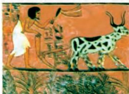
Devorga chizilgan rasm.