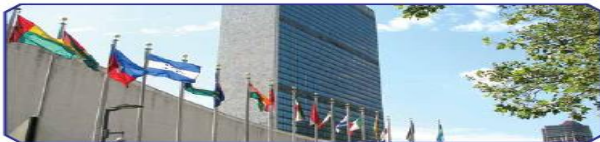
BMT shtab kvartirasi. Nyu-York

O‘zbekiston BMT a‘zoligiga 1992-yil 2-martda qabul qilindi. BMT bosh idorasi Nyu-Yorkda (AQSh) joylashgan.