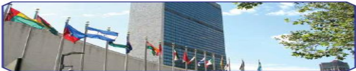
BMT shtab kvartirasi. Nyu-York

O‘zbekiston BMT a‘zoligiga 1992-yil 2-martda qabul qilindi. BMT bosh idorasi Nyu-Yorkda (AQSh) joylashgan.