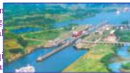
89-rasm. Panama kanali.

Amerikada faqatgina 2 ta davlat - Boliviya va Paragvay - bevosita dengizga chiqish imkoniyatiga ega emas. Meksika, Gvatemala, Gonduras, Nikaragua, Kosta-Rika, Panama va Kolumbiya qirg‘oqlari ikkita, ya’ni Atlantika va Tinch okean suvlari bilan yuviladi. AQSH va Kanada esa uchta - Atlantika, Tinch va Shimoliy Muz okeanlariga chegaradosh.