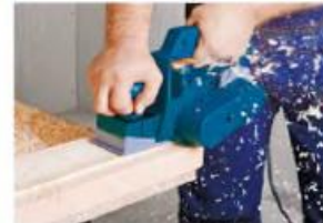
2-rasm. Elektr toki bilan ishlaydigan randalar