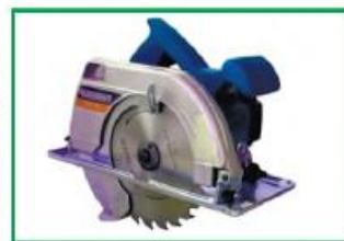
1-rasm. Qo‘lda ishlaydigan elektr tokli asboblardan

gacha, og‘irligi 5 kg dan 10 kg gacha bo‘lgan turlari bor (2-rasm).