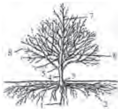
13-rasm. Mevali daraxt tuzilishi:

1 – o‘q ildizlar; 2 – yon ildizlar; 3 – ildiz bo‘g‘in; 4 – tana; 5 – markaziy shox; 6 – o‘sovchi novda; 7 – asosiy (skelet) shoxlar; 8 – o‘sovchi shoxlar.