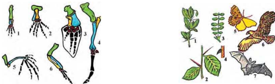
44-45-rasm. Gomologik va analogik organlar.

Analogik organlar deyilganda bajaradigan funksiyasi jihatidan o‘xshash, ammo kelib chiqishi jihatidan har xil organlar tushuniladi. Kaktusning tikanlari barg, do‘lananing tikanlari poya, atirgul, malinaning tikanlari esa epidermis o‘simtalarining o‘zgarishidan hosil bo‘lgan (45-rasm). Boshoyoqli molluskalar ko‘zi bilan umurtqali hayvonlarning ko‘zi ham analogik organlarga misoldir. Boshoyoqli molluskalarda ko‘z ektoderma qavatining cho‘zilishidan, umurtqalilarda bosh miya yon o‘simtasidan rivojlanadi.