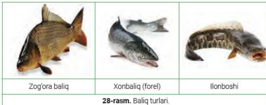
28-rasm. Baliq turlari.

IV. Mashg‘ulotni yakunlash: to‘garak a‘zolarini yutuq va kamchilliklarini muxokama qilish, rag‘batlantirish.