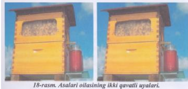
18-rasm. Asalari oilasining ikki qavatli uyalar.