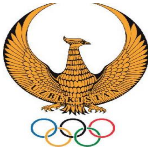
1-rasm. O‘zbekiston Respublikasining Davlat gerbi hamda O‘zbekiston Olimpiya qo‘mitasining emblemasi

II. Amaliy ish: “Geraldika” so‘zi qaysi tildan olingan va qanday ma’noni anglatadi?