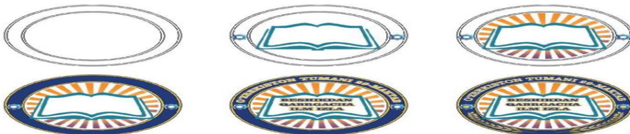
8-rasm. Emblema ishlash bosqichlari

II. Amaliy ish: Kimlarda va qaysi kasb egalarida shaxsiy gerblar bo‘lgan?