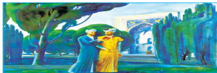
S. Abdullayev. «Navoiy va Husayn Boyqaro»