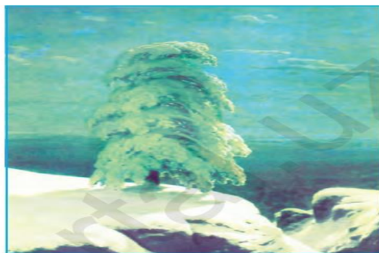
I. Shishkin. «Ayoqli shimol»