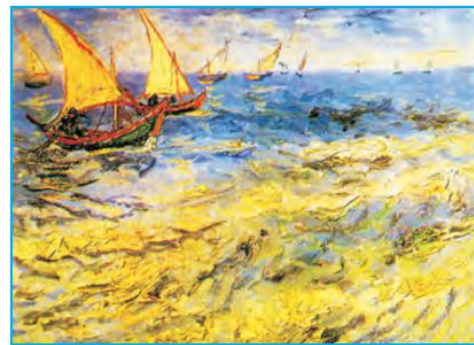
Van Gog. «San-Maridagi dengiz»

II. Amaliy ish: Tasviriy san‘atning qanday ifodaviy vositalarini bilasiz?