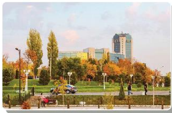
O‘zbekiston tog‘ va shaharlarida kuz manzarasi (foto)