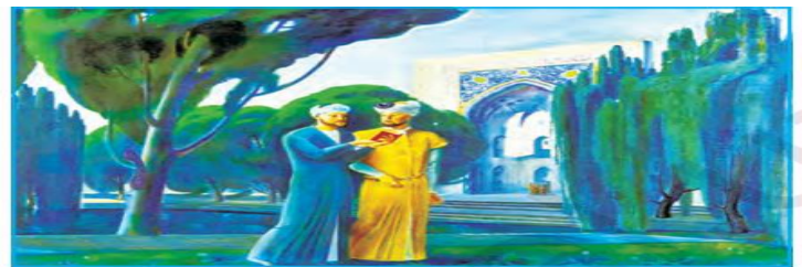
S. Abdullayev. «Navoiy va Husayn Boyqaro»