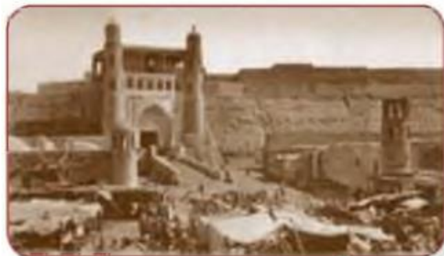
Buxoro arki. XIX asr