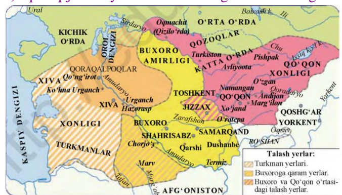
XIX asr o‘rtalarida O‘rta Osiyo davlatlari xaritasi

VI. Uyg‘uz vazifani e‘lon qilish: Darslikdagi 6-betdagi xaritadan foydalanib, quyidagi jadvalni to‘ldiring. Xonliklarga tegishli hududlarni ajratib yozing.