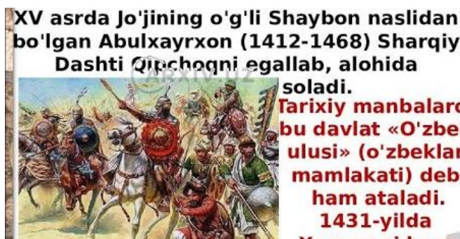
XV asrda Jo‘jining o‘g‘li Shaybon naslidan bo‘lgan Abulxayrxon (1412-1468) Sharqiy Dashti Qipchoqni egallab, alohida soladi.

VI. Uyga vazifani e‘lon qilish: yangi mavzuni to‘liq takrorlash va yangi mavzu yuzasidan bilimlarini mustahkamlab kelish.