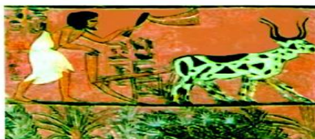
Devorga chizilgan rasm