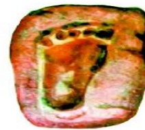
Toshga aylangan iz

Moddiy manbalar. Moddiy manbalar – qadimgi odamlarning suyak qoldiqlari, ular yashagan makon, turar-joylarning, shuningdek, qal‘a va shaharlarning, uy-ro‘zg‘or hamda zeb-ziynat buyumlarining qoldiqlaridir. Shuningdek, qazish natijasida topilgan tangalar, gerblar, muhrlar hamda mehnat qurollaridir. Moddiy manbalarni arxeologlar to‘plashadi. Ular o‘tmishda odamlar yashagan deb taxmin qilingan manzilgohlarda qazish ishlarini olib boradilar.