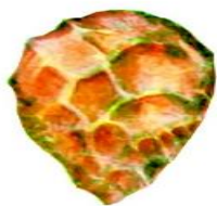
Toshdan yasalgan mehnat quroli

Tarix odamlarning eng qadimgi zamonlardan to hozirgacha bosib o‘tgan hayot yo‘lini aks ettiradi. Bugungi hayotni qanday qurganligi, odamlarning uzoq va yaqin o‘tmishda nima bilan mashg‘ul bo‘lganliklari haqida ma‘lumot beradi. Ularning qanday yashaganliklari hamda qanday tarixiy voqealar yuz berganligini o‘rga tadi. Tarixiy manba. Tarix fani tarixiy manbalar asosida yaratiladi. Xo‘sh, tarixiy manba nima o‘zi?