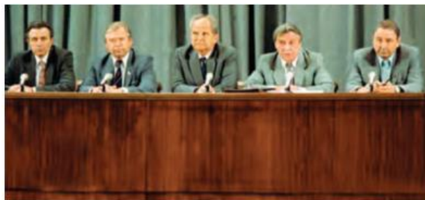
Favqulodda holat davlat komiteti a‘zolari

O‘zbekiston Respublikasi Konstitutsiyasining yaratilish jarayoni qancha muddat davom etdi. Olgan bilimlaringizga tayanib, uning yaratilishini bosqichlarga bo‘lib davrlashtiring.