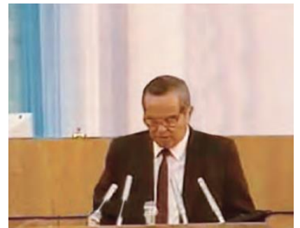
I. Karimov O‘zbekiston Respublikasining davlat mustaqilligini e‘lon qilmoqda.

Maktab MMIBDO‘ _____ sana _____ 20__ yil