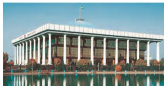
O‘zbekiston Respublikasi Oliy Majlisining binosi

Maktab MMIBDO‘ _____ sana _____ 20__ yil