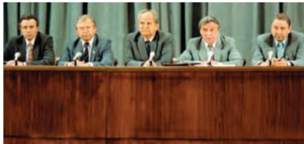
Favqulodda holat davlat komiteti a‘zolari

O‘zbekiston Respublikasi Konstitutsiyasining yaratilish jarayoni qancha muddat davom etdi. Olgan bilimlaringizga tayanib, uning yaratilishini bosqichlarga bo‘lib davrlashtiring.