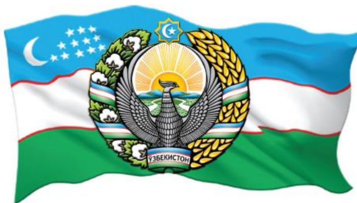
Символы государства: герб и флаг