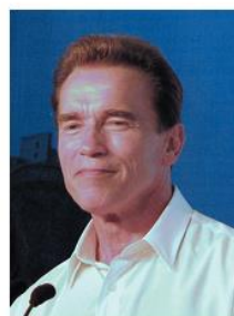
Это Арнольд Шварценеггер...

Зам директора школы _____ дата _____ 20__ год