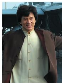
Это Джеки Чан...