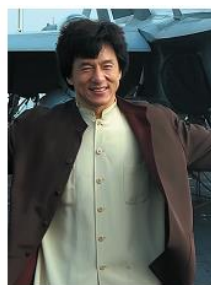
Это Джеки Чан...