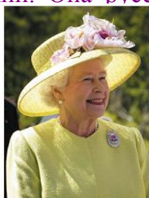
Это Елизавета II...

Образец: Это Полина Гагарина. Она певица. Она живёт в России. Её родной язык русский. Она русская.