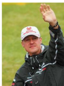
Это Михаэль Шумахер...