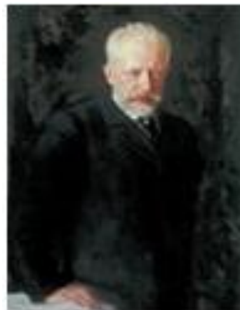
Н. Д. Кузнецов. Портрет П. И. Чайковского

7. Домашнее задание. Напиши одно предложение о себе. Во что ты любишь играть?