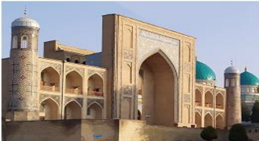
Ko'kaldosh madrasasini XVI asrda Darvishxon qurdirgan.