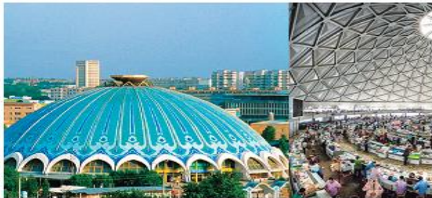
Chorsu – 1000 yillik tarixga ega bozor.