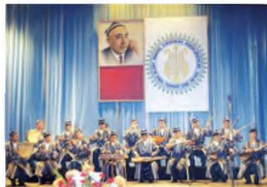
Zamonaviy cholg‘uchilar ansambli

Mumtoz musiqa tarkibi ikki xil shaklga ega bo‘ladi. Ulardan biri cholg‘u musiqasi bo‘lsa, ikkinchisi, ashula yo‘lidir. Cholg‘u musiqasi tarkibi eng sodda xalq kuylaridan tortib to murakkab maqom namunalargacha bo‘lgan asarlarni o‘z ichiga oladi. Shularning orasida maqom cholg‘u yo‘llari bilan birga juda ko‘p an‘anaviy mumtoz asarlar ham bor. Mumtoz kuylarni o‘zbek bastakorlari turli davrlarda yaratganlar. Mumtoz kuylar azaldan o‘zbek xalq cholg‘ulari - tanbur, dutor, g‘ijjak, nay, chang va sumay kabi sozlarda ijro etib kelingan. Eng ommabop cholg‘ularimizdan yana biri doiradir. Amaliyotda aksariyat mumtoz kuylar yakka cholg‘ularda hamda jo‘mavozlikda ijro etib kelinmoqda. Biz sevib tinglaydigan mumtoz kuylar juda ko‘p. Ularga “Hojiniyoz I-II”, “Cho‘li Iroq”, “Mirzadavlat”, “Munojot”, “Savti Munojot”, “Ufori Munojot”, “Ilg‘or”, “Rohat”, “Rajabiy”, “Sharob I-II”, “Aliqambar”, “Qo‘shchinor”, “Navro‘zi Ajam” kabi kuylarni misol qilish mumkin. Shulardan bolalarga mo‘ljallanganlari “Dilxiroj”, “Jonon”, “Lazgi” kabi kuylardir.