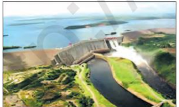
2-rasm. Dunyodagi eng yirik suv omborlaridan biri – Karuna daryosidagi Guri suv ombori (Venesuela).