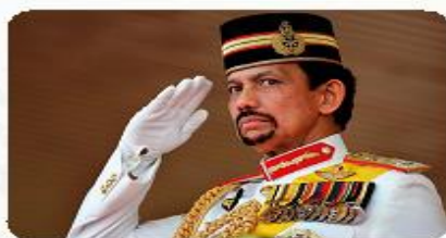
Brunei sultoni Hassanal Bolqiya