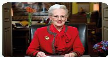
Daniya qirolichasi Margrete II

Jahon mamlakatlarining muhim belgilaridan biri boshqaruv shakli hisoblanadi. Siyosiy boshqaruvning ikki asosiy shakli — respublika va monarxiyaga ajratiladi. Jahonning siyosiy xaritasida 2022-yil boshi holatiga ko‘ra, boshqaruv shakli respublika bo‘lgan 151 ta davlat mavjud. Respublikalar asosan 3 ta turga bo‘linadi: prezidentlik, parlamentar hamda aralash.