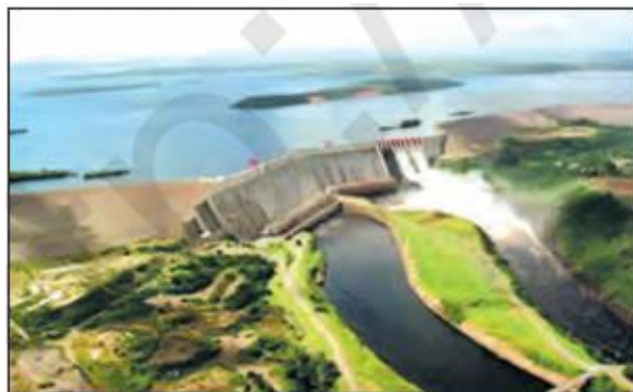
2-rasm. Dunyodagi eng yirik suv omborlaridan biri – Karuna daryosidagi Guri suv ombori (Venesuela).