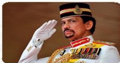
Bruney sultoni Hassanal Bolqiya