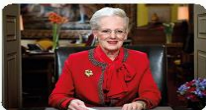
Daniya qirolichi Margrete II

Jahon mamlakatlarining muhim belgilaridan biri boshqaruv shakli hisoblanadi. Siyosiy boshqaruvning ikki asosiy shakli — respublika va monarxiyaga ajratiladi. Jahonning siyosiy xaritasida 2022-yil boshi holatiga ko‘ra, boshqaruv shakli respublika bo‘lgan 151 ta davlat mavjud. Respublikalar asosan 3 ta turga bo‘linadi: prezidentlik, parlamentar hamda aralash.