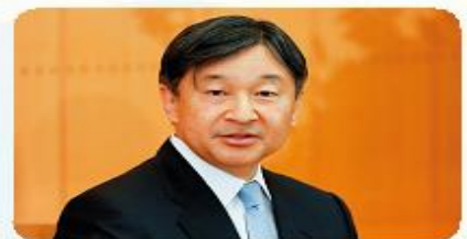
Yaponiya imperatori Naruhito