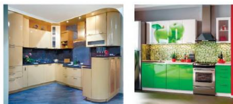
14-rasm. Oshxona javonlari