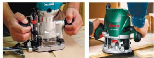
4-rasm. Elektr toki bilan ishlaydigan frezerlash va uyalar ochish asboblari

IV. Mashg‘ulotni yakunlash: to‘garak a‘zolarini yutuq va kamchiliklarini muxokama qilish, rag‘batlantirish.