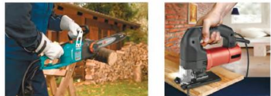
3-rasm. Elektr toki bilan ishlaydigan qo‘l arralari