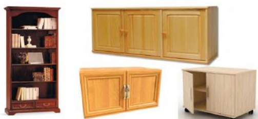
12-rasm. Kitoblar uchun javon