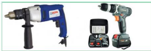
5-rasm. Elektr toki bilan ishlaydigan parmalash asbobi va «shurupoviyort»

Shuning bilan birga, yog‘och buyumlarni pardozlash uchun elektr toki bilan ishlaydigan asboblardan foydalaniladi ( 6-rasm ).