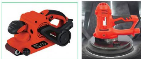
6-rasm. Elektr toki bilan ishlaydigan pardoqlash asboblari