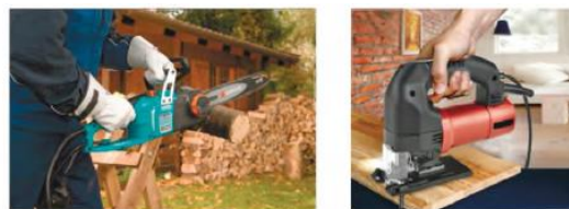
3-rasm. Elektr toki bilan ishlaydigan qo‘l arralari