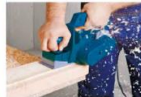
2-rasm. Elektr toki bilan ishlaydigan randalar