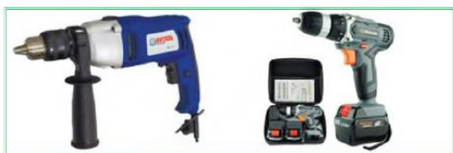
5-rasm. Elektr toki bilan ishlaydigan parmalash asbobi va «shurupoviyort»

Shuning bilan birga, yog‘och buyumlarni pardoqlash uchun elektr toki bilan ishlaydigan asboblardan foydalaniladi ( 6-rasm ).