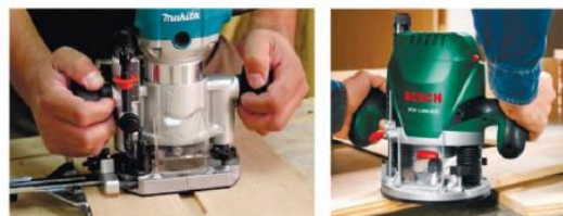
4-rasm. Elektr toki bilan ishlaydigan frezerlash va uyalar ochish asboblari

IV. Mashg‘ulotni yakunlash: to‘garak a‘zolarini yutuq va kamchiliklarini muxokama qilish, rag‘batlantirish.