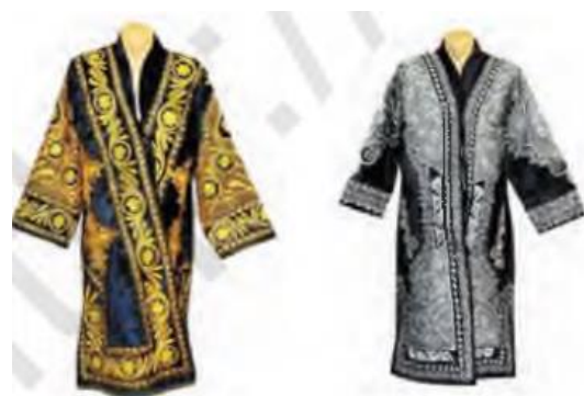
38-rasm. Tashqi shaklning uzviyligi va yaxlitligi.

VI. Uyga vazifani e‘lon qilish: yangi mavzuni to‘liq takrorlash va yangi mavzu yuzasidan bilimlarini mustahkamlab kelish.