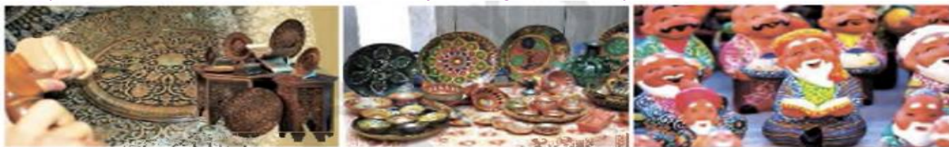
1-rasm. Xalq hunarmandlari ishlaridan namunalari.

Asrlar davomida orttirilgan va madaniy boyligimiz, xususan, sho‘ro tuzumi davrida o‘zbek milliy xalq amaliy bezak san‘atining eng ko‘p rivojlangan turlaridan ganchkorlik, naqqoshlik, yog‘och o‘ymakorligi, toshtaroshlik, suyak o‘ymakorligi, kandakorlik, pichoqchilik, zargarlik, kashtachilik, zardo‘zlik, gilamchilik kabi turlarning o‘ziga xos tomonlari, bajarish texnologiyasi, haqiqiy asl nomlari, o‘ziga xos maktablari, uslublarini yaratgan ustalarning nomlari asta-sekin yo‘qolib ketish xavfi ostida qoldi. Bugungi kunda mustaqil mamlakatimizda xalqimizning asrlar bo‘yi yaratgan mehnati natijasida yaratilgan amaliy bezak san‘atini ko‘z qorachig‘idek saqlash, qadrlash, ulardan amaliy foydalanish, yoshlarga o‘rgatish orqali ularning estetik didini o‘stirish hamda yuksak madaniyatli kishilar qilib tarbiyalash uchun keng imkoniyatlar ochildi. Abu Rayhon Beruniy, Abu Ali Ibn Sino, Al-Xorazmiy, Nizomiy Ganjaviy, Nosir Xisrav, Alisher Navoiy, Kamoliddin Behzod, Bobur kabi jahonga mashhur olim, shoir va musavviralar xalqimizni go‘zallikka intilishga chaqirgan. Bobomiz Amir Temur hunar va ilm egalari, yirik mutaxassis olimlar yordamiga tayanib matematika, geometriya, me‘morchilik, astronomiya, adabiyot, tilshunoslik, tarix, musiqa, tasviriy san‘at va hattotlik kabi san‘at asarlarini rivojlantirishga katta ahamiyat berdi.