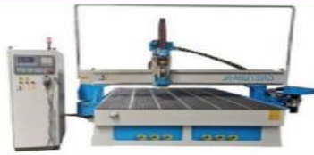
Raqamli dastur bilan boshqariladigan frezalash stanogi