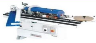
Yog‘och materiallar chetlariga qoplamalar qoplovchi stanok