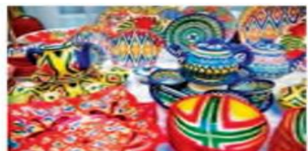
36-rasm. Hunarmandlarimiz tomonidan eksport va ichki bozor uchun ishlab chiqarilayotgan mahsulotlar.